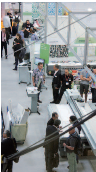
Anwendungsstandorten bei vielen Ausstellern im Mittelpunkt wie hier bei Canon.

Einige der wichtigsten Neuvorstellungen von der Fespa Digital 2014 in München finden Sie im hinteren Teil des Heftes ab Seite 54 sowie in der nächsten Ausgabe von «Druckmarkt impressions»..